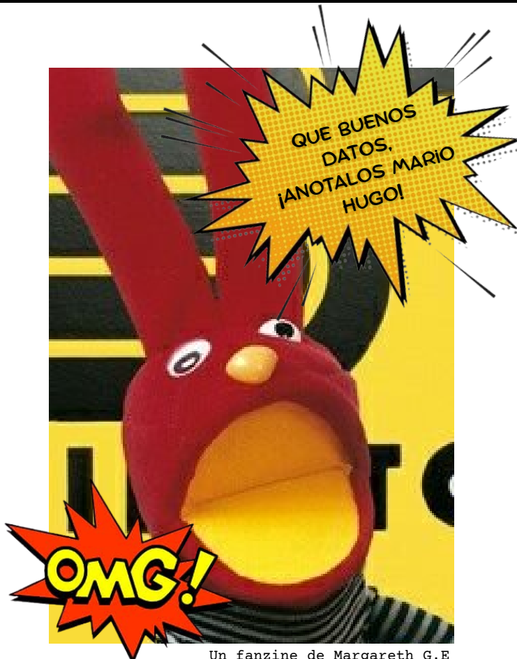
Un fanzine de Margareth G.E