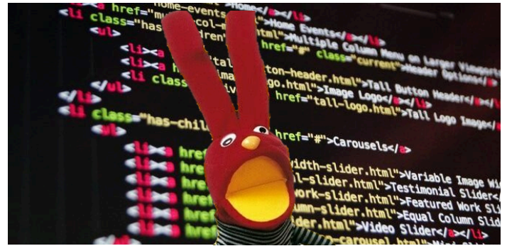
Fotografía del periodista BODOQUE

Pero ¿Cómo consiguió esa información en misterioso anónimo?